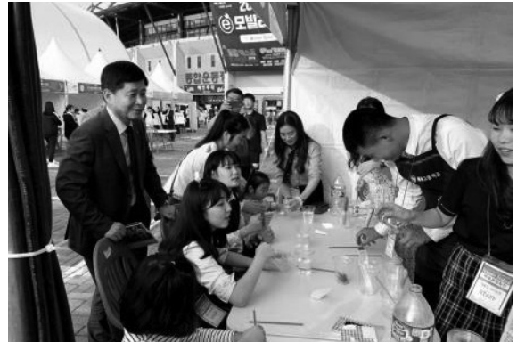
장석웅 교육감님의 과학축전 부스 방문