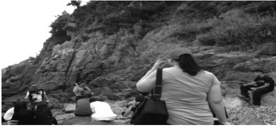
백수 해안도로 지질 답사