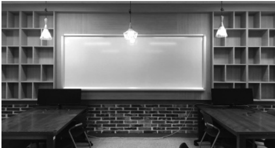
창의 융합 과학실