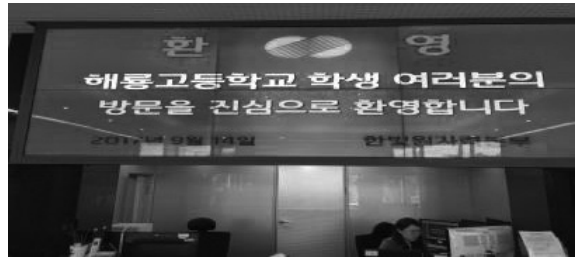
[그림 2] 지역 체험학습 및 홍보활동