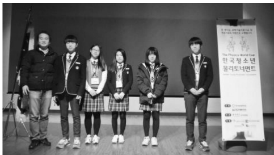
[그림 6] KYPT대회 참가 사진

뿐만 아니라 진학 실적에도 잘 나타났고 대부분의 학생들이 자신이 희망 하는 대학에 진학하는 성과를 보여 주고 있습니다.