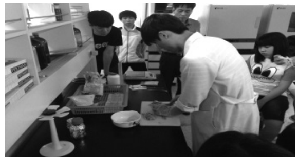
굴비 시료 분석