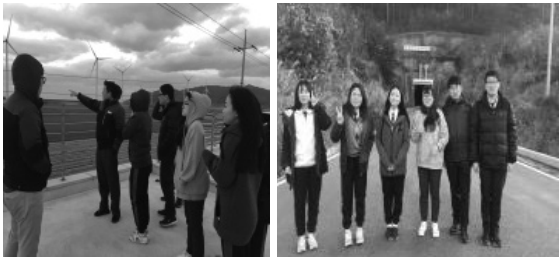
원자력발전소 견학 및 중성미자 연구소 견학