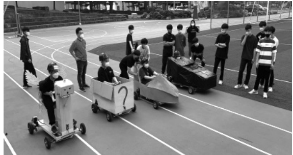
전동 카트 만들기 활동