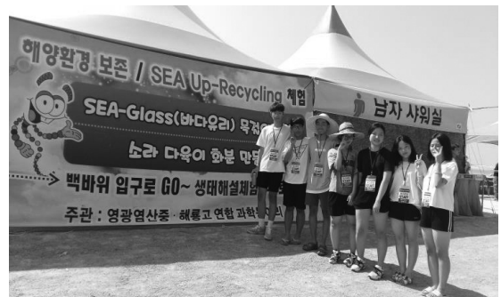
[그림 3] 염산 백바위 과학 체험 부스에서 환경보존활동과 관광지 안내 활동

인근에는 전국 유일의 중성미자 연구소가 있어 소규모 체험 학습하기에는 매우 유용한 장소입니다. 그리고 염산의 백바위는 해안가 주변이 검은색 화산암인데 반해 흰색의 화강암질 바위로 구성되어 있어 잘 알려지지 않은 관광지입니다. 매년 이곳에서 지역 축제가 열렸고 과학 동아리는 지역사회(축제)와 연계하여 과학 체험 부스를 열고 백바위의 지형적 특성을 설명해 주는 활동을 실시하였습니다.